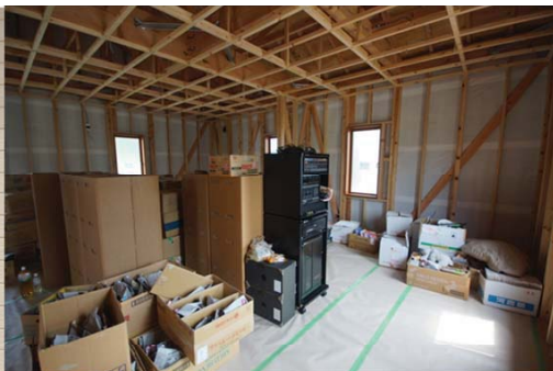
びつき棟 「音楽スタジオ」 内装はこれから