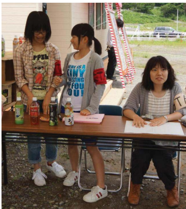
開所式受付 (大学生と高校生)