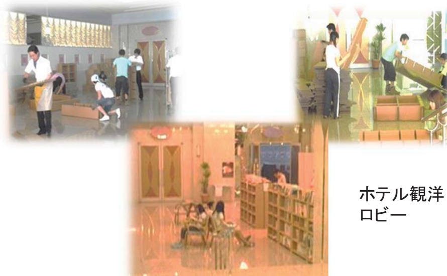
ホテル観洋 ロビー