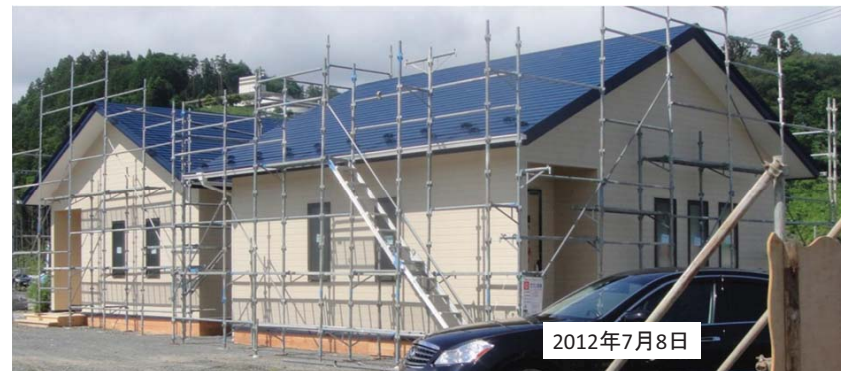
子ども達の夢実現の第一歩