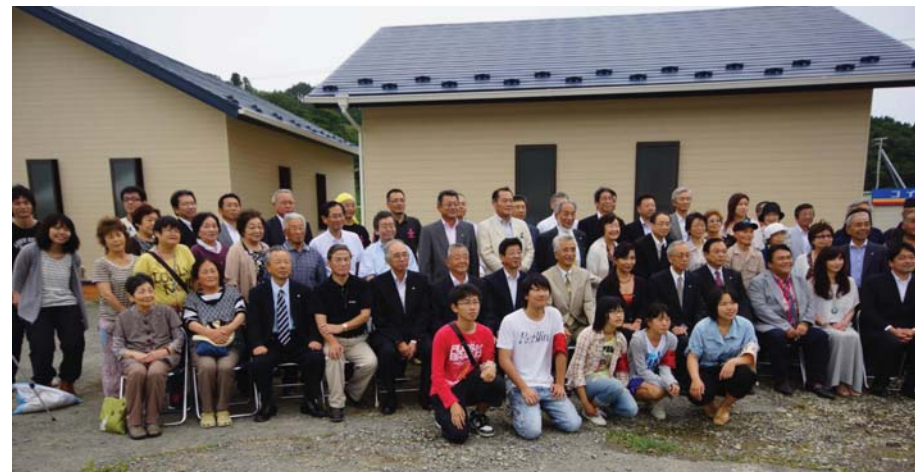
開所式閉会後の記念撮影